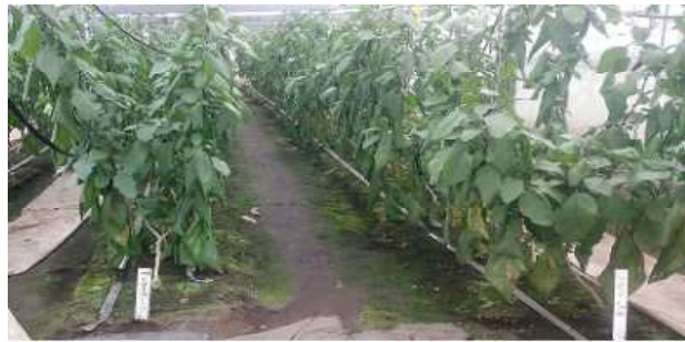
調査区の設置状況